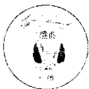
Тематический раздел. ФГОС общего образования. Государственная регламентация